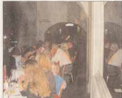
Ein langer Tisch mit fröhlichen Menschen: Ein Hauch «Italianità» in Bern