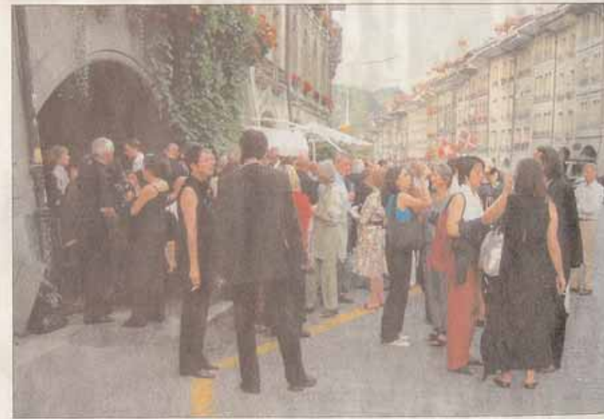
Die Zufallsgesellschaft von «la salle du monde» trifft sich vor dem Festmahl zum Apéro in der «Webern»