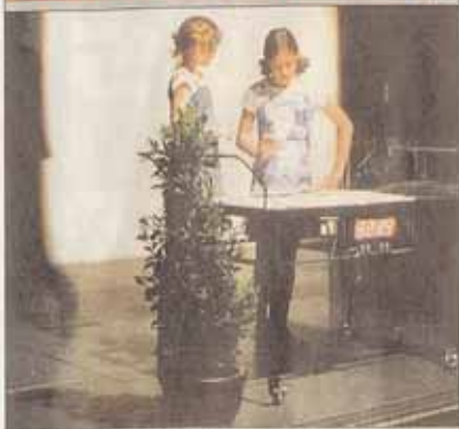
Die meisten Gäste von «la salle du monde» wurden im Mai im Kornhausaal ausgelost