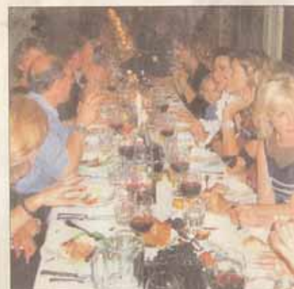
... dann gings zu Speis und Trank