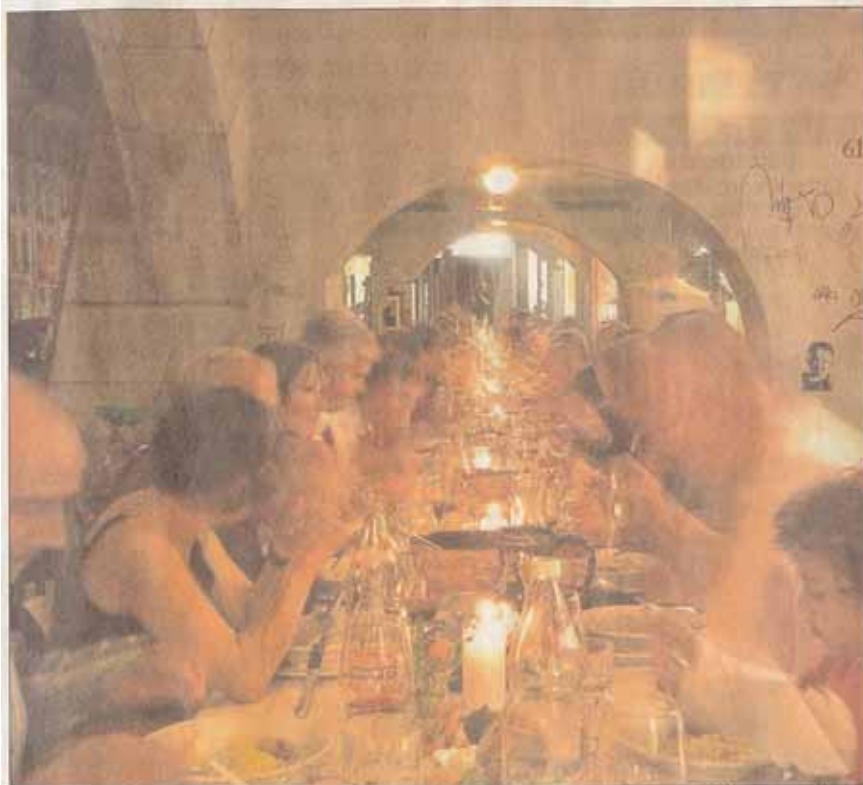
100 nach einem Aufruf im Bernerbär und auf TeleBärn ausgeloste Frauen, Männer und Kinder sowie rund 50 Sponsoren speisen nun jedes Jahr am 3. September zusammen

Drei Dîners der Zufallsgesellschaft Bern im öffentlichen Raum der Stadt Bern