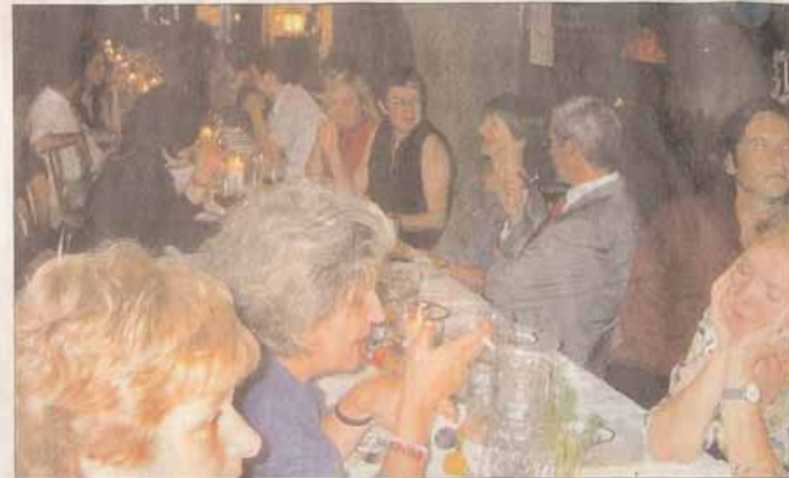
Bis nächstes Jahr, am gleichen Tag, zur gleichen Zeit! Wo? Das bleibt ein Geheimnis! Irgendwo in Bern jedenfalls