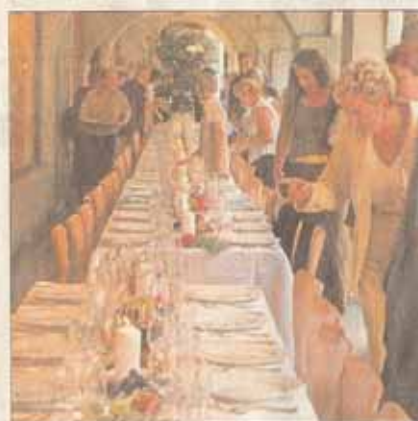
Zuerst die Suche...