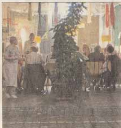
Da staunten spät abendliche Stadtschleicher: Was tut sich da unter den Lauben?