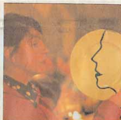
Das bin ich! «La salle du monde»-Gast mit seinem Profil auf dem Teller