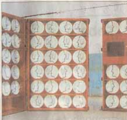
Teller mit dem eigenen Profil und die signierten Gläser werden durchs Jahr hindurch an unterschiedlichen Orten ausgestellt