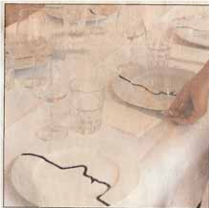
... fand seinen Platz dank der persönlichen Unterschrift auf dem Kristallglas