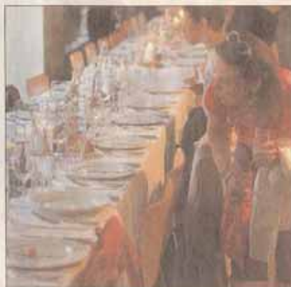
Wer sein eigenes Profil nicht erkannte...